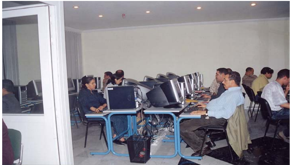
Grupo de alumnos y alumnas en Agadir.

Para Radio ECCA, las nuevas tecnologías se han convertido en una herramienta para luchar contra la desigualdad. Internet también puede contribuir a hacer realidad el lema institucional: «La mejor formación posible para el mayor número de personas posible».